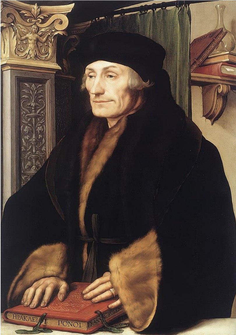
Hans Holbein, ritratto di Erasmo da Rotterdam, 1523, National Gallery, London.

ERASMUS è acronimo di E uropean R egion A ction S cheme for the M obility of U niversity S tudents ma è anche richiamo ad Erasmo da Rotterdam, immenso pensatore che, conciliando tradizione classica, radici cristiane e viaggi in tutta Europa, elaborò una libera visione dell'essere umano.